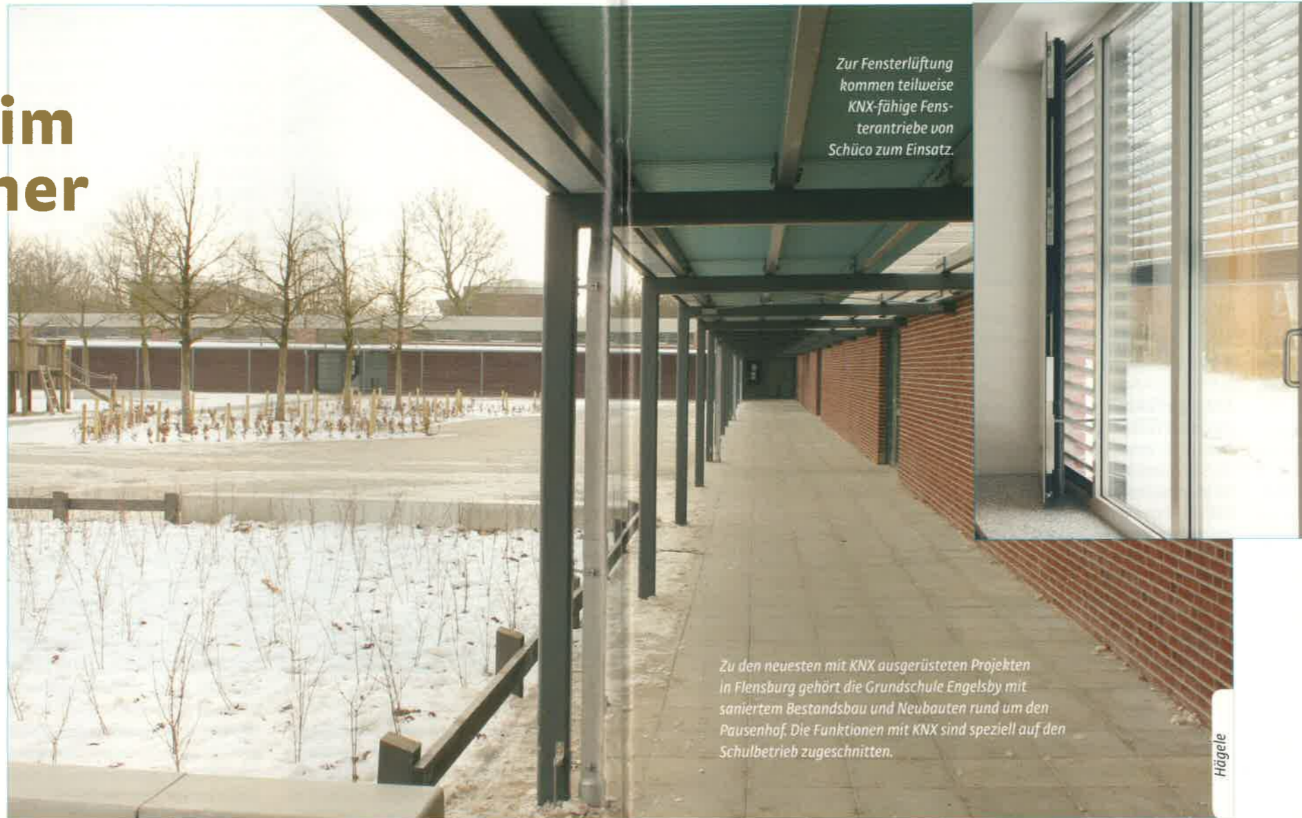
Zur Fensterlüftung kommen teilweise KNX-fähige Fensterantriebe von Schüco zum Einsatz.

An die Gebäudeautomation in Schulen werden besondere Anforderungen gestellt. In Flensburg haben die Techniker der Stadt damit reichlich Erfahrung gesammelt und forschen trotzdem weiter. So wird eine CO 2 -geführte Fenstersteuerung in ihrer Wirkung beobachtet und dokumentiert, um optimale Bedingungen zu erreichen.