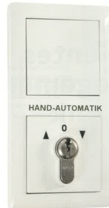
Schlüsselschalter für die Umschaltung der Fensterlüftung von Automatik- auf Handbetrieb

Mit Zentralbefehlen können Funktionen in der Gebäudetechnik schnell und sicher in einen gewünschten Zustand gesetzt werden. So schaltet der Befehl »Zentral Aus« alle Leuchten im Innenbereich ab. Dabei bleiben die Präsenz- und Bewegungsmelder zur Sicherheit evtl. noch anwesender Personen aber aktiv. Mit dem gleichen Befehl fahren alle Sonnenschutzbehänge hoch und alle schaltbaren Steckdosen gehen vom Netz. Für einen schnellen Überblick der Gebäudedefunktionen sowie für Einstellungen von Werten und Schaltzeiten wurde die KNX-Anlage auf eine Visualisierung aufgeschaltet. Die Gestaltung der Menüseiten entspricht der einheitlichen Vorgabe von der Abteilung Baumanagement der Stadt Flensburg. Die Startseite mit Grundriss der Anlage zeigt gleichzeitig die Daten der Wetterstation an. Über den Einstieg können Teilbereiche mit Beleuchtung, mo-